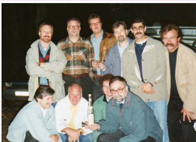
1993 Asselborner Mühle

Die Männer und einige Frauen essen am Samstag natürlich Hämmchen. Die anderen Frauen bedienen sich der Speisekarte.