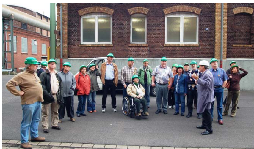
2007 Sindorf / Kerpen