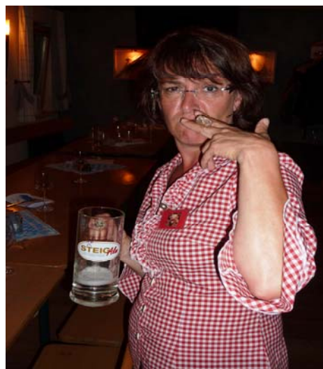
2011 Steig-Alm Bad Marienberg