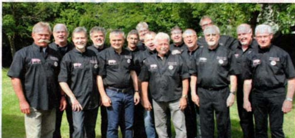
15 restlos begeisterte Hämmchen-Freunde feiern 20-jähriges Jubiläum.

darauf geachtet, ob das Salz partiell im Überfluss aufgetragen wurde oder professionell mit einer Spritze dem Hämmchen zugeführt wurde. Auch die Größe des Knochens oder die unvermeidlichen Haarrückstände auf dem Hämmchen werden genau unter die Lupe genommen, bewertet und schriftlich benotet. Das Testessen unterliegt strengen Kriterien, auch das Bein der Kellnerin fließt in die Bewertung ein. „Schließlich müssen wir wirklich alle Hämmchen testen. Hosen geben schon von vornherein Punktabzug“, gibt Theo Kirfel augenzwinkernd zu Protokoll. Dann muss die Kellnerin einen Stuhl besteigen und der Präsident nimmt Maß. Geboren wurde die Idee bei einem Essen im „Em Goldene Kappes“ in Köln-Nippes, um sich auch in der karnevalslosen Zeit regelmäßig zu treffen. Einmal im Jahr, immer Ende September, geht es dann mit den Ehefrauen auf Hämmchen-Tour. Dann wird drei Tage lang die Sau raus gelassen. Das Hämmchen-Haupt-