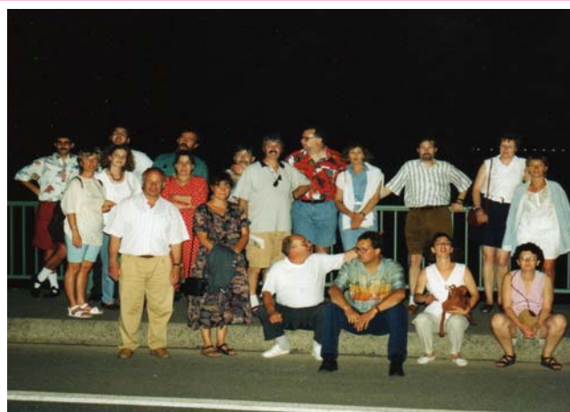
1994 Brauhauswanderweg Köln