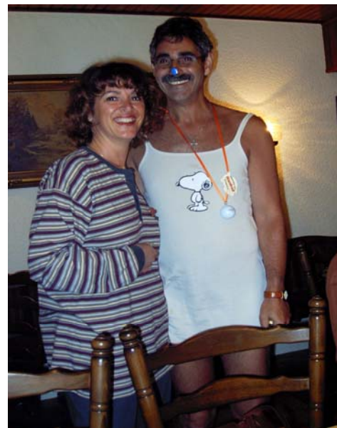
2004 Windecker Ländchen