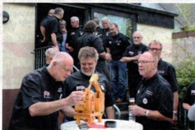
Wie das Hämmche, wird auch die Schnupftabakmaschine genau begutachtet.